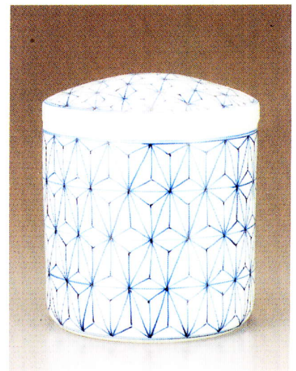
麻の葉紋 (あさのはもん) 7寸 ¥36,000-